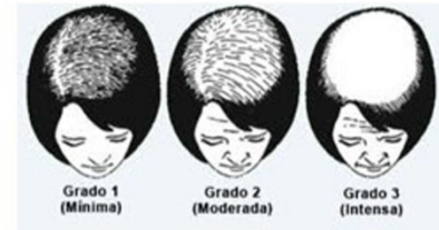
Escala de Ludwig